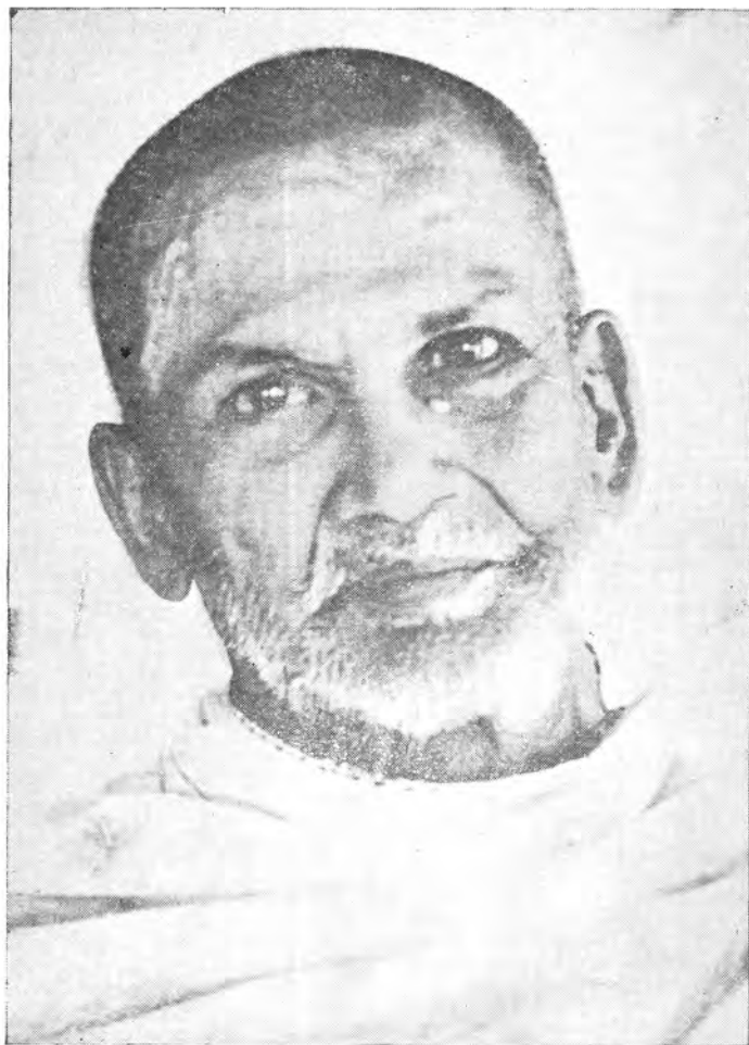
ஸ்ரீ முகவைக் கண்ண முருகனார்